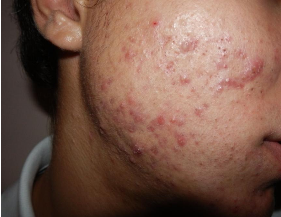
Figura 2: Aspectos clínicos do processo inflamatório da acne.

Fonte: Adaptado de CARTON, et al. , 2007.